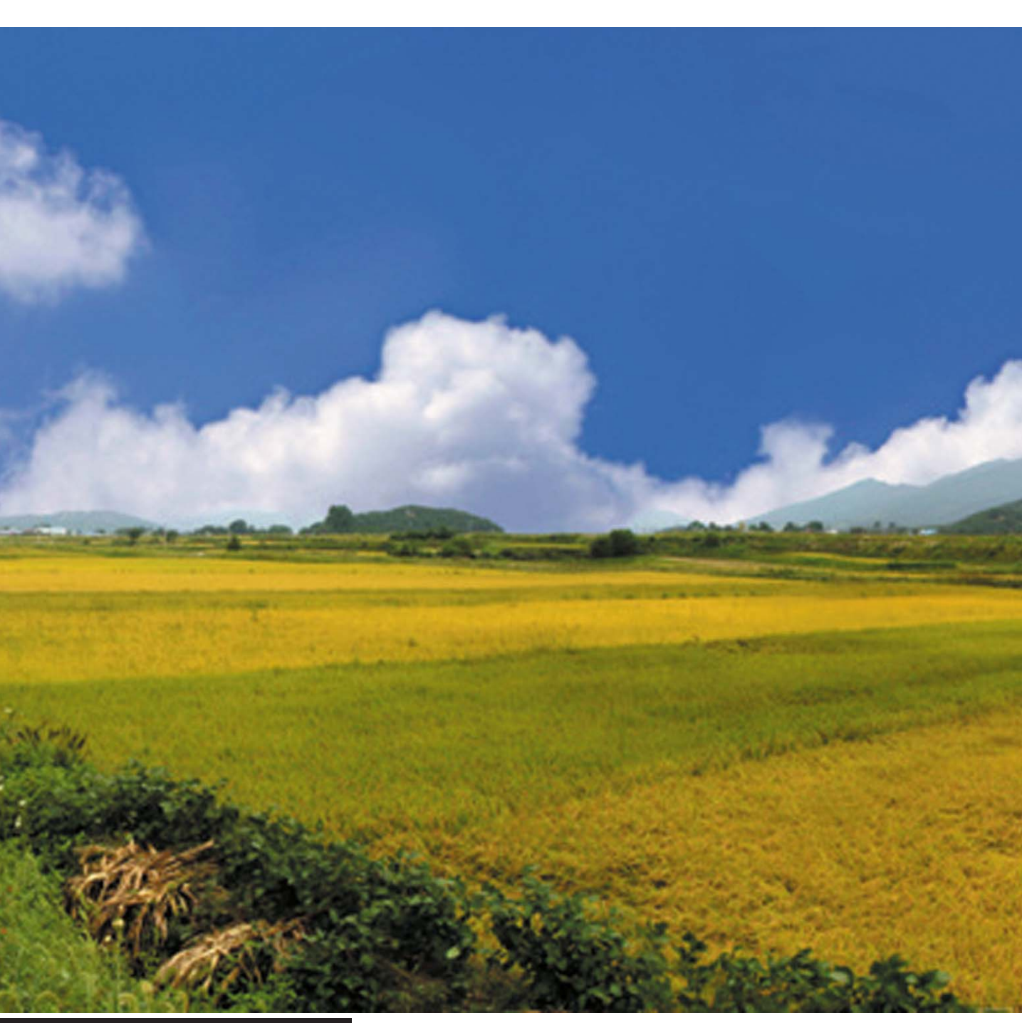
글_ 우성덕 취재팀장

가을걷이를 기다리는 들판이 황금빛으로 물들었다. 풍성한 수확이 기다리고 있지만 쌀값하락 소식에 농민들의 마음은 무겁다. 황금빛 들녘은 농민의 땀과 눈물. 수많은 이품과 사연을 고스란히 간작하고 있지만, 도시인들의 눈에는 그저 이름답기만하다.